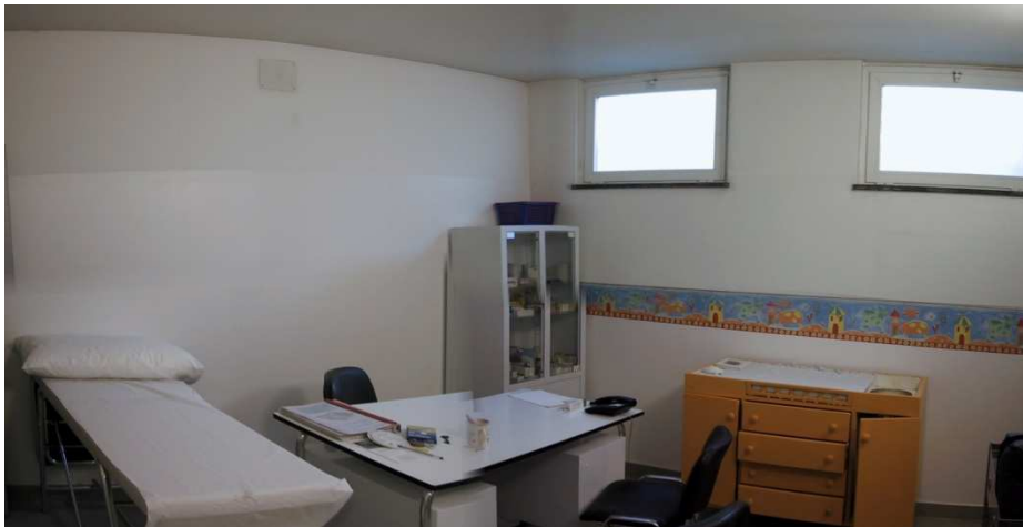
Uno degli ambulatori

Le figure professionali che operano all'interno del Consultorio svolgono visite cliniche con l'ausilio di strumenti medico sanitari periodicamente sottoposti a sterilizzazione e/o controlli specifici.