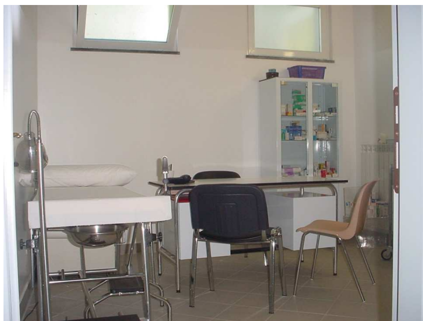
Uno degli altri ambulatori

Tutti i professionisti sono dotati di cartellino di riconoscimento.